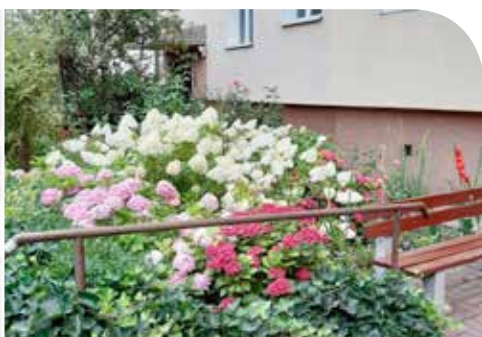
Osiedle Mieszka I 8-14