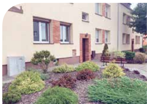
Fryderyka Chopina 1-3