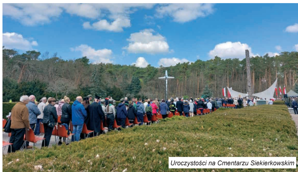
Uroczystości na Cmentarzu Siekierskim

mujemy się przy Pomniku Wdzięczności, którym uhonorowano żołnierzy 1. Armii Wojska Polskiego poległych podczas forsowania Odry i w drodze do Berlina. Składa się on z kilku elementów: wysokiego obelisku, na którym umocowano dwa grunwaldzkie miecze, żagli symbolizujące przeprawę przez Odrę i stojącej obok obelisku kobiety z dzieckiem na rękach, symbolu rozpaczliwej matki po stracie ukochanego dziecka. Tuż obok pomnika umieszczono później metalowy krzyż.