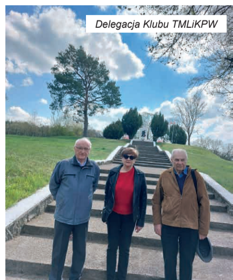
Delegacja Klubu TMLiKPW

Z Czeline jedziemy do Gozdowic, gdzie przy Pomniku Saperów ma miejsce jedna z dwóch głównych uroczystości (Gozdowice, Stare Łysogórki).