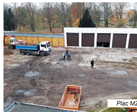
Plac MZK przed i po.