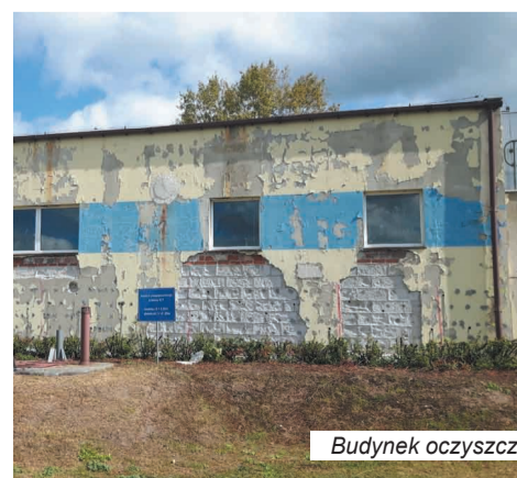
Budynek oczyszczalni przed naprawą i po.