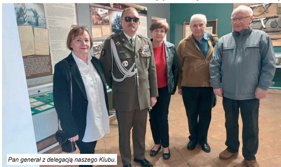
Pan generał z delegacją naszego Klubu.

Z Gozdowic jedziemy do Starych Łysogórek na główne uroczystości. Tu zatrzy-