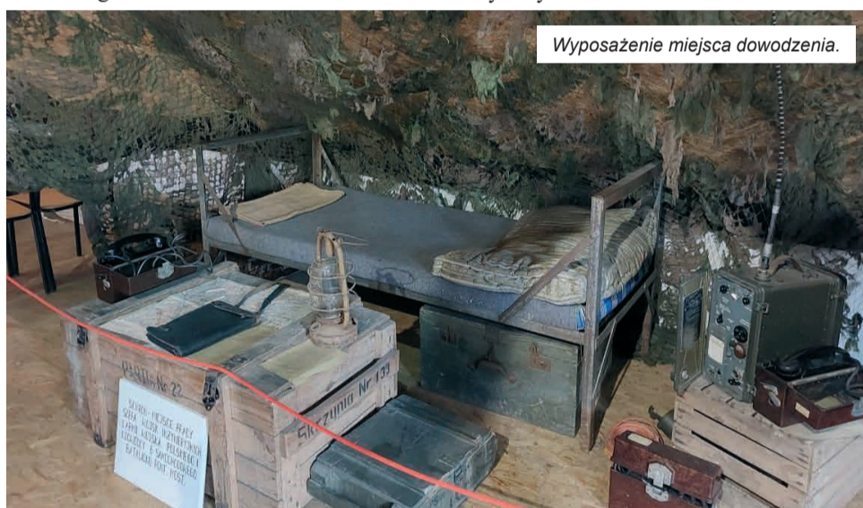
Wypożyczenie miejsca dowodzenia.