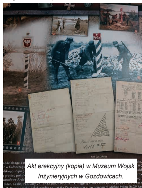
Akt erekcyjny (kopia) w Muzeum Wojsk Inżynieryjnych w Gozdowicach.

Żołnierze pod słupem zakopali butelkę z dokumentem, pod którym podpisało się prawie 70 osób. Podano w nim też nazwiska żołnierzy poległych na polu chwały. Następnego dnia o świcie słup został zniszczony przez niemiecką artylerię. Zakopaną pod słupem butelkę odnaleźli żołnierze WOP