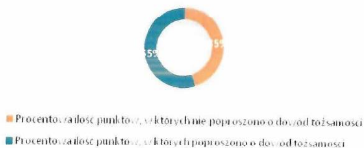
Wykres 1. Wyniki I audytu „Tajemniczego klienta” 2022.