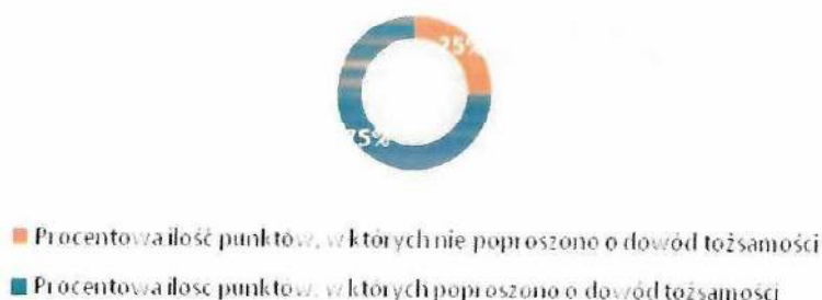
Wykres 2. Wyniki II audytu „Tajemniczego klienta” 2022.

Podsumowując niniejsze szkolenie w pierwszym i drugim audycie należy zauważyć ( pomijając te punkty sprzedaży, które w czasie I i II audytu były zamknięte, tj. 20 punktów ), że podczas I audytu tylko 55 % sprzedawców odmawiało sprzedaży bez okazania dokumentu. Natomiast podczas II audytu odmawiało już 75 % sprzedawców. Mamy tutaj wzrost aż o 20 % odmów co jest bardzo pozytywnym wynikiem kontroli i szkolenia podczas I audytu, gdzie sprzedawcy zostali „złapani za rękę” dzięki czemu podczas II audytu, który odbył się po ponad 2 tygodniach mamy dużo lepszy wynik. Pozwala to na stwierdzenie, że powtarzanie audytu co roku byłoby korzystnym zjawiskiem. Cykliczna powtarzalność szkoleń i audytów w dłuższym okresie czasu będzie przyzwyczajala sprzedawców do tego typu zabiegów i według naszego długoletniego doświadczenia zwiększała ich wiedzę oraz czujność. 20