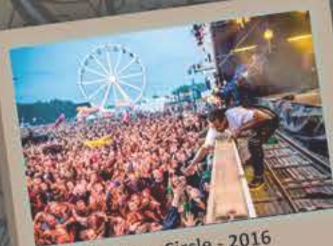
Inner Circle - 2016