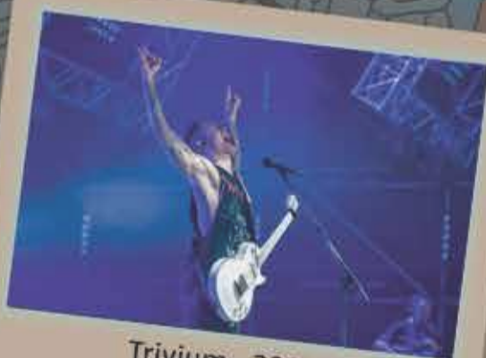
Trivium - 2017