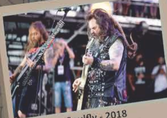
Soulfly - 2018