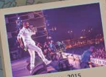
Shaggy - 2015