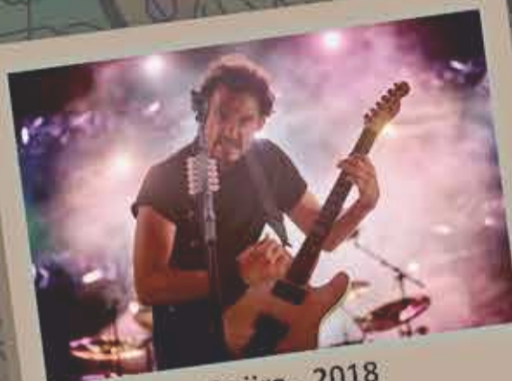
Gojira - 2018