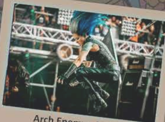
Arch Enemy - 2018