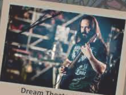
Dream Theater - 2015