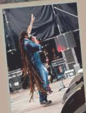
Damian Marley - 2012