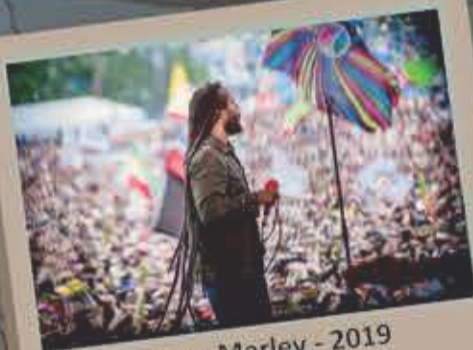
Ziggy Marley - 2019