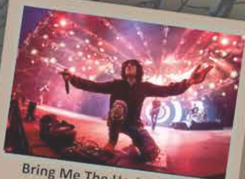
Bring Me The Horizon - 2016