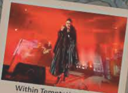
Within Temptation - 2015