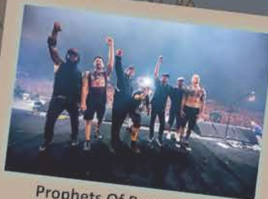
Prophets Of Rage - 2019