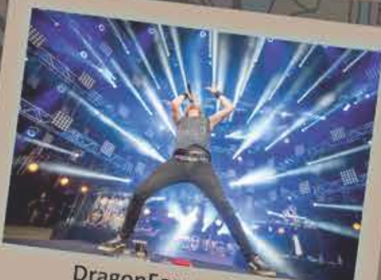
DragonForce - 2016