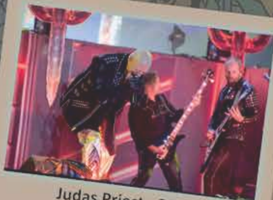
Judas Priest - 2018