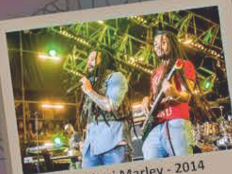
Ky-Mani Marley - 2014