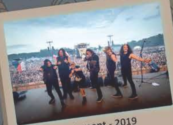
Testament - 2019