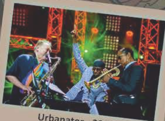
Urbanator - 2017