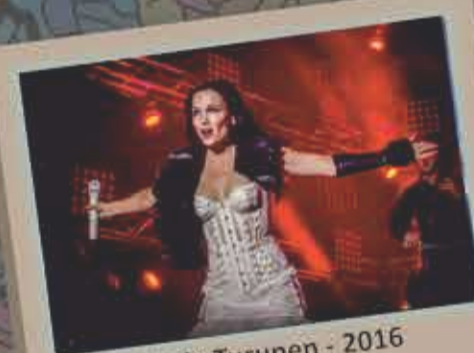
Tarja Turunen - 2016