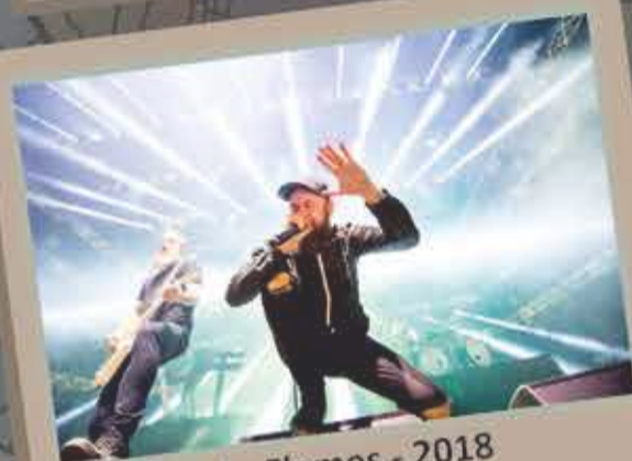
In Flames - 2018