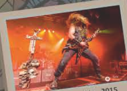
Black Label Society - 2015