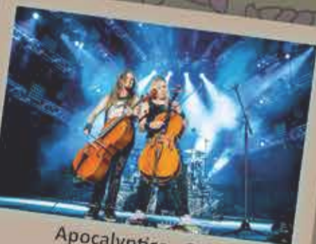
Apocalyptica - 2016