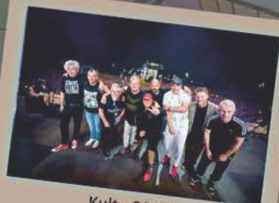
Kult - 2019