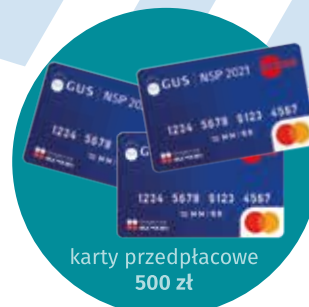
karty przedpłacone 500 zł