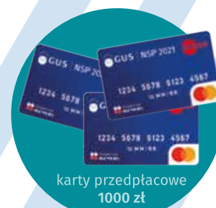
karty przedpłacone 1000 zł