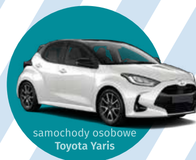
samochody osobowe Toyota Yaris

Nie czekaj! Spisz się już dziś i weź udział w Loterii! Pierwsze losowanie już 7 maja br.!!!