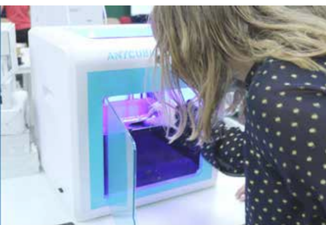
W sobotę 15 maja wznowiliśmy zajęcia dla dzieci - Drukowanie 3D