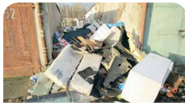
ulica Targowa (garaże) - przed i po interwencji Straży Miejskiej

Komendant Straży Miejskiej w Kostrzynie nad Odrą